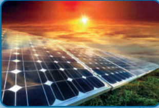
GÜNEŞ ENERJİ SİSTEMİ TAKİBİ