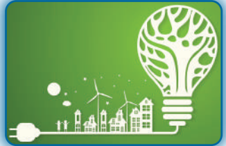
ENERJİ TAKİBİ VE VERİMLİLİĞİ