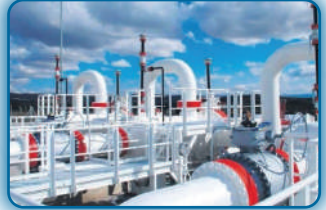
DOĞAL GAZ TAKİBİ